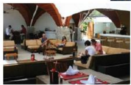
▲ Beach Republic以歐洲海灘俱樂部（Beach Club）為主題，可真的吸引不少西方遊客。