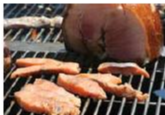
▶▶星期日的Sunday Brunch好熱鬧，自助餐供應源源不絕，真的可食足3小時！

每個星期日11:30-15:00，Beach Republic的早午餐 (Sunday Brunch) 時段都很熱鬧，自助燒烤加上多款精美小食，一個價錢食足3小時，很多在蘇梅工作的外籍人士也喜歡來這裏，有的甚至一家大細前來，邊吃邊聊天，拿著雞尾酒晃蕩，或半躺在沙發上，或到泳池浸泡，然後再食過，樂也融融。下午3時開始有現場DJ助興，播放節奏悠閒的House和Ambient電子音樂。逢星期四晚上19:00-22:00淑女之夜，女士可享免費雞飲，全晚有DJ打碟。對於鍾愛電子音樂又愛打扮的年輕人來說，Beach Republic會讓你樂而忘返。