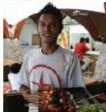
▲服務員個個年輕有活力。