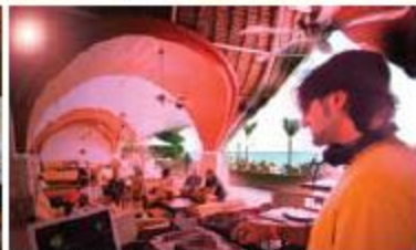
▲現場DJ播放輕鬆的電子音樂，還以為自己在西班牙biza呢！